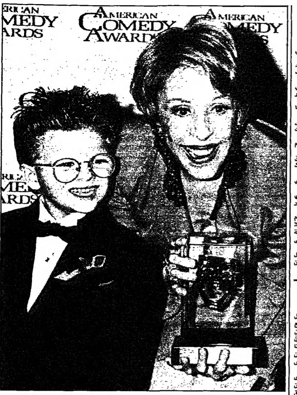
فازت الفنانة الكوميدية الأمريكية كارول بورنيز بجائزة أفضل كوميدية في التلفزيون التي حصلت عليها أس في حفل جوائز الكوميديا الأمريكية ويظهر معها الممثل الصغير جوناثان لينيكي

■ أنزيم (هولندا) - رويترز: يعرجن اللون الأحمر دائما على سوق الأزهر في أنزيم. ولكن قبل أيام من عيد الحب (يوم القديس فالنتين) تصفح بائعات من الورود الغرضية على هذا المعرض الفواح.